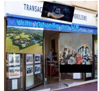
Image moderne, vitrine dynamique, mise en valeur des biens de façon optimum (météo, vue par drone de l'environnement...). Gain de temps (et d'argent), efficacité des visites devant apporter une augmentation du taux de transformation

Avantages pour le vendeur : Bénéficier d'une prestation amenant à la vente du bien plus rapidement